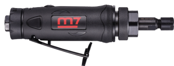
QA9120 + NE405