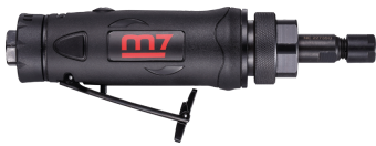
QA9120 + NE405