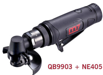
QB9903 + NE405