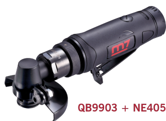
QB9903 + NE405